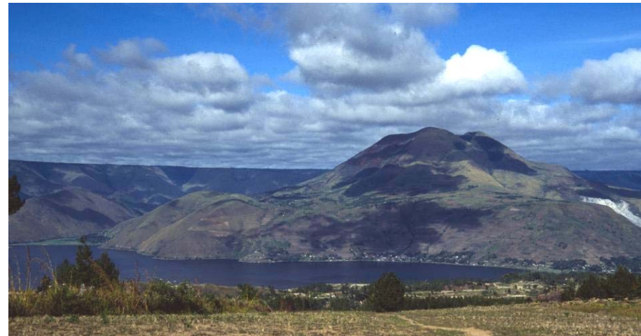
Der Berg - Wohnsitz der Göttin

DIA-Vortrag: ca. 1,5 Std. mit Musik-Mitschnitten; Präsentation von Webereien, anschließend Gespräch